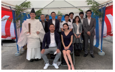
▲(仮称)清水町マンション新築工事

今回は「地鎮祭」について取り上げさせていただきます。その他にもお客様のご要望によっては「竣工式」や「完成お披露目式」など様々な式典にも対応させていただきます。また、こういった例以外にも工事以外のところでご相談いただくことは、可能な限り営業部にて対応いたしますので、お気軽にご相談ください。それではまた次号でお会いしましょう。