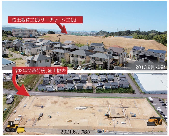
2013.9月 撮影 / 2021.6月 撮影

暑中お見舞い申し上げます。 ルミノシティー近藤です。 2009年10月、新居浜市東田に誕生した全210戸の美しが丘にはいまプロジェクト、いよいよ最終章です。 現地では、2021年10月街びらきに向け、梅雨時期の天候不順やコロナ感染症対策を踏み日々、頑張る作業を行っています。 大型分譲地の販売担当者として、約12年間、美しが丘の現場を身近で見えてきましたが、悪天候や地盤が想定より硬いなど、思わぬことが生じる中、どの街区も工期厳守で施工しており、建設業は自然相手といいますが、本当にパワフルでたくましく有難いことです。