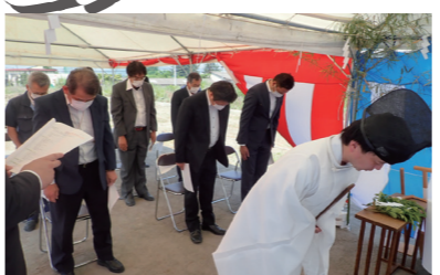
▲(仮称)SPC観音原危険倉庫新築工事